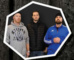
LE BLOC HIP-HOP

POUR RECHERCHE D'EMPLOYÉS, NOUS OFFRONS JUSQU'À 20% DE DIFFUSIONS SUPPLÉMENTAIRES!