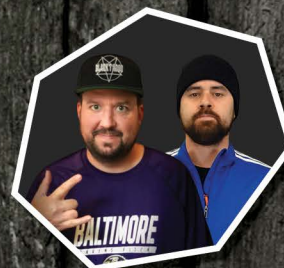
LAURENT ET LES TRUANDS