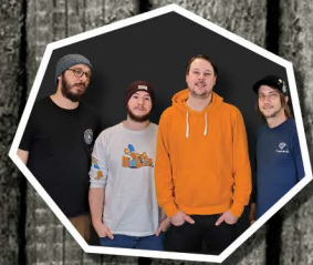
LE BINGO LE PLUS FOU AU MOONDE!

NOUS SOMMES FORTEMENT PORTÉS SUR L'APPLICATION DE RABAIS (ÉCONOMIE D'ÉCHELLE) SELON L'IMPORTANCE DES ACHATS. FAITES-EN LA DEMANDE À VOTRE CONSEILLER PUBLICITAIRE.