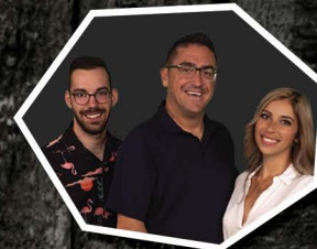
LE PARTY 969