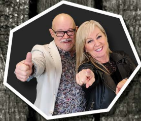
LES HITS DU VENDREDI- SAMEDI