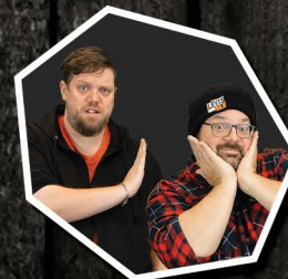
LES DEUX SNOOZES